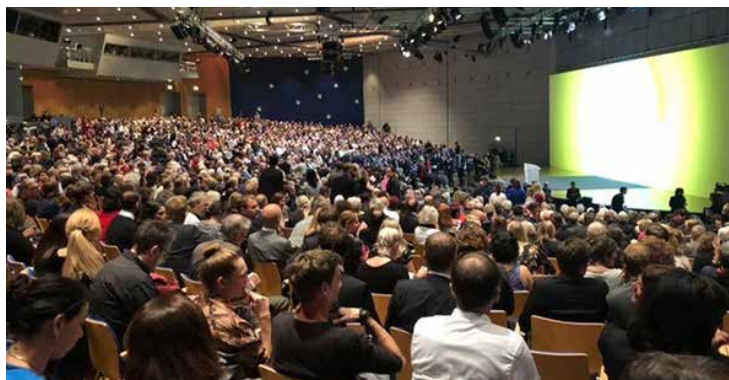
Inauguración de la Feria del Libro de Fráncfort.