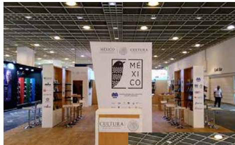
Pabellón de México en la feria de Fráncfort.